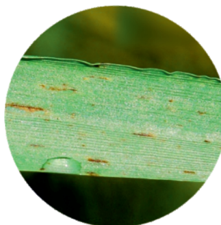
КОНТУР АРГЕНТ 0,2 л/га